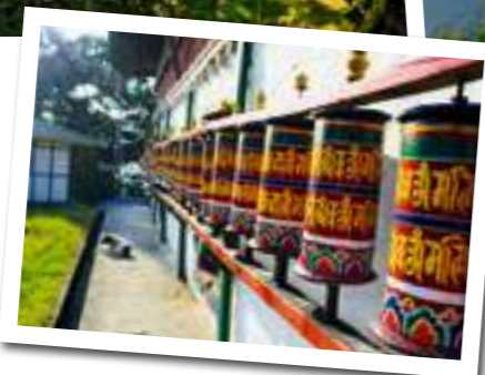
Das Kloster Ranka in Sikkim mit den Gebetsmühlen (l.). Der Besucher treibt sie mit der Hand an.

Das tönt vielversprechend. Also versuchen auch wir unser Glück und suchen uns den