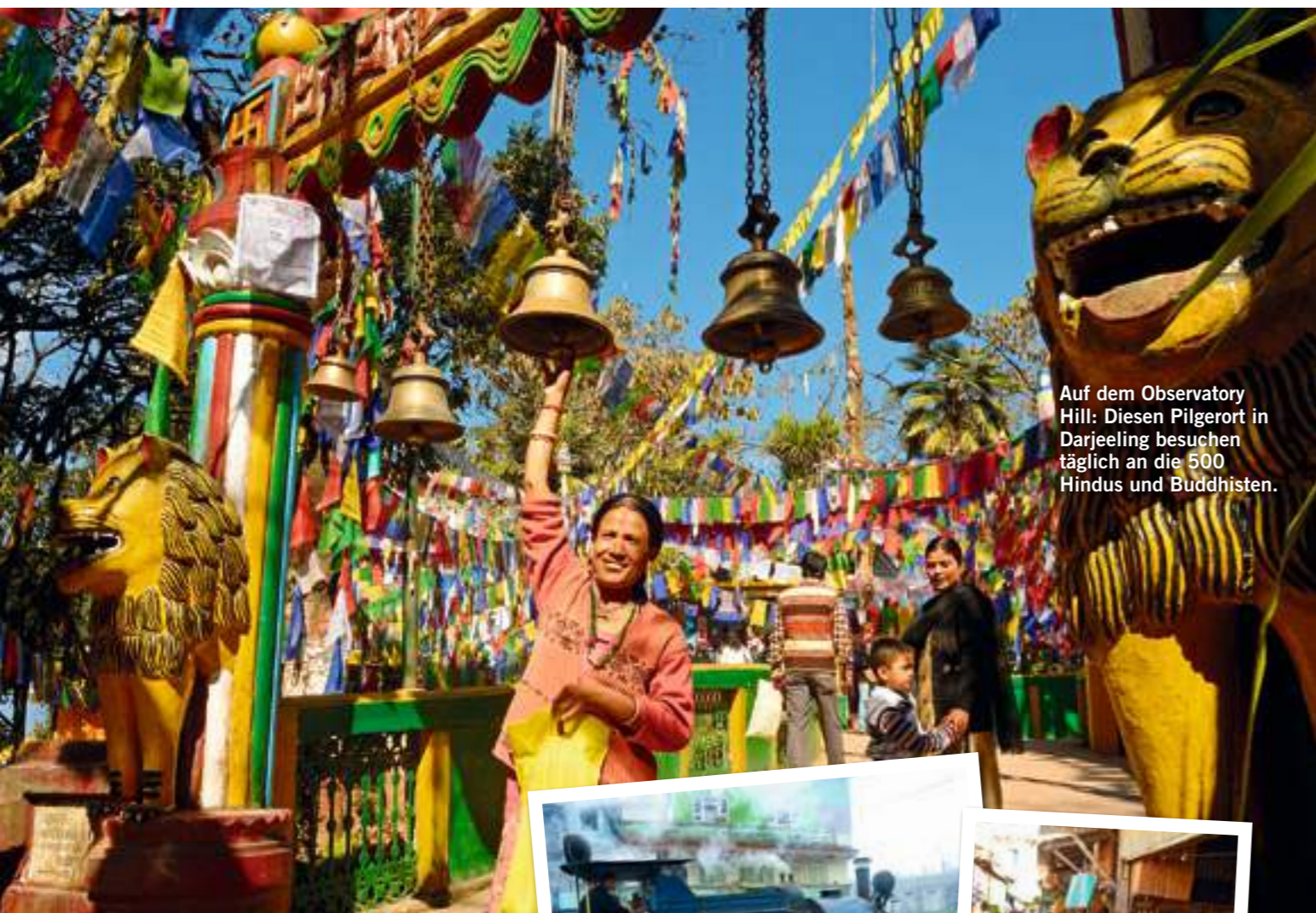
Auf dem Observatory Hill: Diesen Pilgerort in Darjeeling besuchen täglich an die 500 Hindus und Buddhisten.