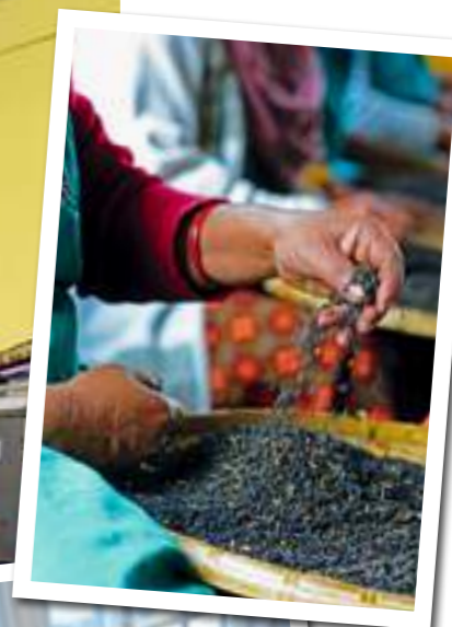
Darjeeling-Tee ist nicht nur ein Landwirtschaftsprodukt, sondern eine eigene Kultur.