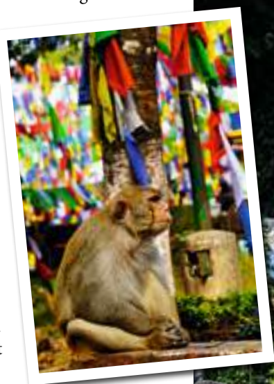
Makaken zeigen sich überall, wollen aber nicht gestreichelt werden.

Gestärkt geht es anderntags weiter. Wir möchten in dem alten Dorf den grossen Schamanen Bungtin treffen, der uns ein Geheimnis seiner Kunst offenbart: «Manchmal spiele ich auf der Flöte, um mit den Naturgeistern in Kontakt zu kommen. Manchmal reicht auch mein Rosenkranz.» Danach besuchen wir das Kloster Ranka mit den rot und gelb gekleideten Mönchen. Dort plätzen wir in eine Zeremonie: Im Tempel des furchterregenden Mahakala schlagen die Mönche die Trommeln. Mit dem Zweck, die Ignoranz und das Böse zu vertreiben. Andere Mönche rezitieren tibetische Gebetsprüche, Mantras, die sprechend, flüsternd oder singend wiederholt werden. Das kraftvollste lautet «Om mani padme um». Mögen alle Wesen ihrem Leiden entkommen und zu ewiger Glückseligkeit finden.