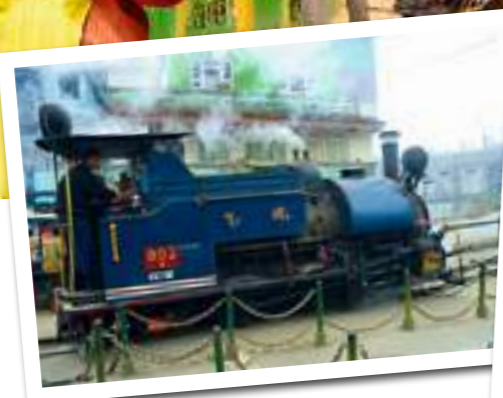
Früher transportierte die Dampfbahn Tee, heute bringt sie Touristen nach Darjeeling. Der dortige Markt hält nebst Tee auch andere Erzeugnisse der Region feil.