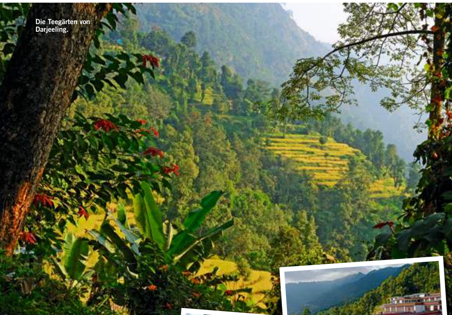
Die Teegärten von Darjeeling.

die kostbaren Teeblätter in Bambuskörben zur Manufaktur bringen, wo sie getrocknet, gerollt und fermentiert werden. Und dann in exklusiven Faltkartons und Holzboxen verpackt auch auf den Markt in Darjeeling kommen.